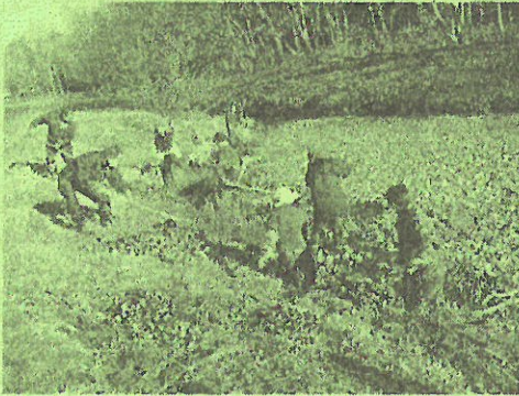
ホタル池の清掃及び外来種の駆除