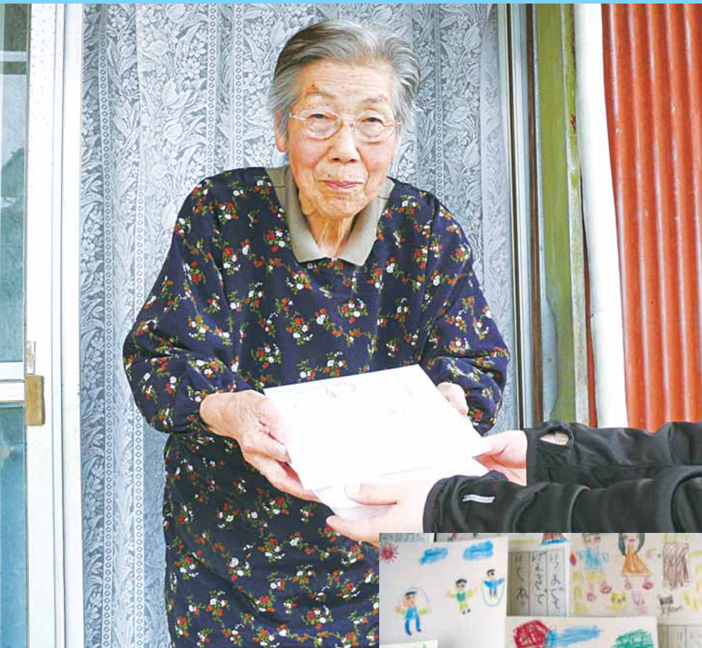
藤岡地区給食サービスの様子 (詳細は6ページをご覧ください。)

〒328-0027 栃木市今泉町2-1-40 (栃木保健福祉センター内) ☎0282-22-4457 FAX0282-22-4467 ホームページ: http://www.tochigishi-shakyo.or.jp/ メールアドレス: tochigishishakyo@cc9.ne.jp