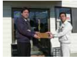
アキレスウェルダール(株) ㈱呉光製作所社員一同