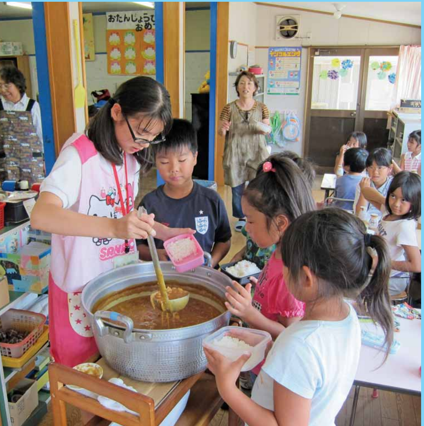
西方地区ボランティアスクール“学童保育スタッフ補助”の様子（関連記事2ページに掲載）

〒328-0027 栃木市今泉町2-1-40 (栃木保健福祉センター内) ☎0282-22-4457 FAX0282-22-4467 ホームページ: http://www.tochigishi-shakyo.or.jp/ メールアドレス: somu-tochigi@tochigishi-shakyo.or.jp