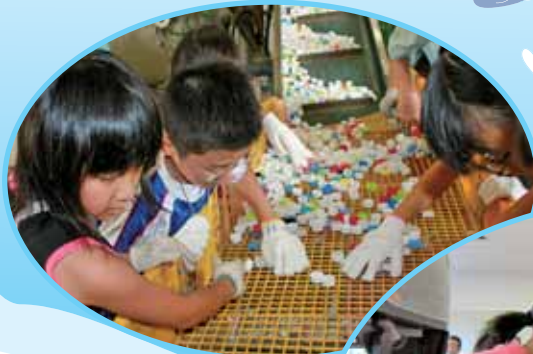
エコキャップ工場見学↑