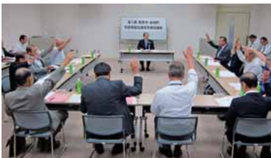
第1回栃木市・岩舟町社会福祉協議会合併協議会の様子