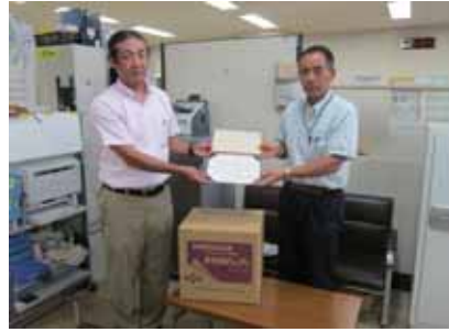
(社) 栃木県医薬品配置協会