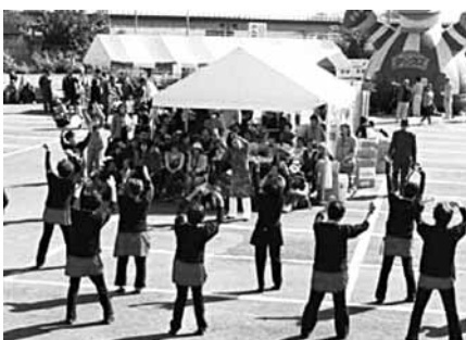
(よさこいを見学する来場者)

なお、収益金1,104,689円は、本会に寄付していただきました。 皆さんのご協力ありがとうございました。