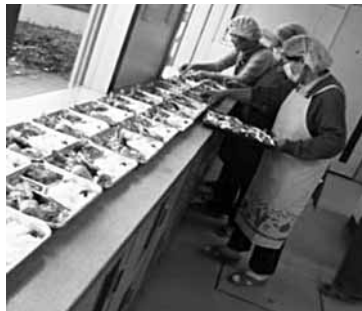
(お弁当を作るボランティアさん)

調理室の見学の後に、大平町の調理ボランティアさんの皆さんと実施内容について、意見交換会が行われました。※ふれあい弁当事業は、大平町内の一人暮らし、二人暮らしの高齢者世帯、障がいをお持ちで月1回程度の見守りが必要とされる方を対象に、手作り弁当を届けるものです。