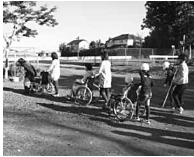
(車いす体験の様子)

はればれ交流会 10月27日(土) 西方総合文化体育館におい て、はればれ交流会が開催さ れました。 昨年と同様、西方地区の老 人クラブや障がい者団体など が参加し、福引きや玉入れな どの小運動会を楽しみまし た。運動会の後は、白鷺大学 ダンス部が華麗なるチャリー ディングを披露。 参加した高齢者の皆さんは