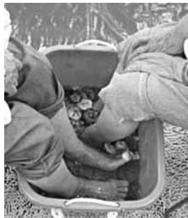
(バラの足湯を満喫)

ふれあいサロンは、定員が10名ほどで、都賀支所の多目的ホールで開催されています。利用者の一人は、「送迎や昼食を用意してくれるボランティアさんがとても親切ですし、特にお昼が美味しくて、完食しました。皆さんとのお喋りが楽しくても良いです。今回は、足湯にバラの花が入っていて、感激しました。」と感想を述べていました。