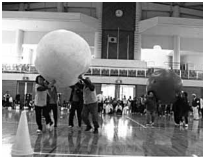
(スポーツを楽しむ参加者の様子)

藤岡総合体育館において、栃木市老人クラブ連合会藤岡支部主催、藤岡地区民生委員児童委員協議会高齢者部会の協力のもと老人スポーツ大会が開催されました。