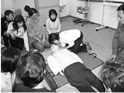
(心肺蘇生法の実技の様子)

デイサービス利用者に打ちだて、茹でたてのそばを提供していただき、この日を楽しくみにしていた利用者の皆さんは喜んでいました。