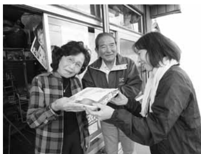
(笑顔でお弁当を受けとる高齢者)

配食の内容は、保存可能なおせちとしました。配達にはボランティアさんが担当して、必ず「一声こえ掛け」をして様子を確認してから手渡すことを心がけてもらいました。