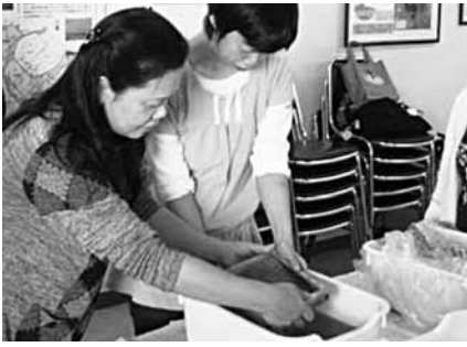
(ヨシの紙すき体験の様子)

藤岡地域活動支援センターでは、地域との交流を促進することを目的に、野外研修を実施しました。利根川上流河川事務所の協力により、渡良瀬遊水地のヨシを利用した「紙すき体験」では葉書き作りをしました。利用者の皆さんは、思い思いに楽しそうに紙すきをしていました。紙をアイロンで乾かす時は少し難しそうでしたが、葉書きが完成すると、満足そうな笑みを浮かべていました。