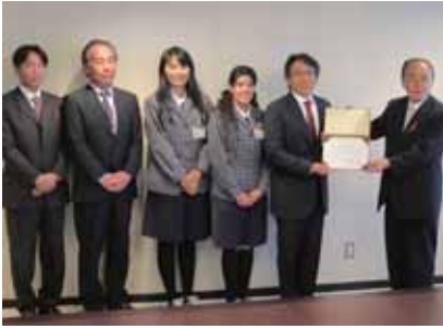
両毛ヤクルト販売(株)