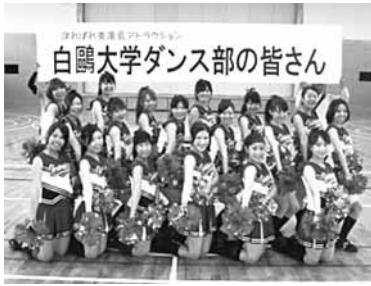
白鷺大学ダンス部の皆さん (華麗なダンスを披露した ハッピーペコの皆さん)

はればれ交流会 10月27日(土) 西方総合文化体育館におい て、はればれ交流会が開催さ れました。 昨年と同様、西方地区の老 人クラブや障がい者団体など が参加し、福引きや玉入れな どの小運動会を楽しみまし た。運動会の後は、白鷺大学 ダンス部が華麗なるチャリー ディングを披露。 参加した高齢者の皆さんは