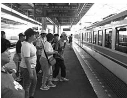
(バス・電車に乗って野外訓練)

バス・電車とも初めて体験する利用者もいましたが、無事に帰ってくる事が出来ました。