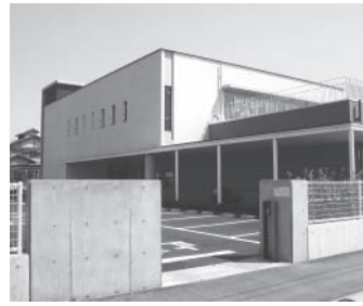
《長寿園》☎22-0333 藪部町 2-14-9