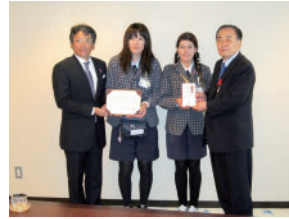
両毛ヤクルト販売株式会社