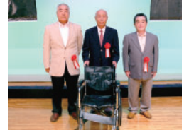
田中正造を芸能で語り継ぐ会