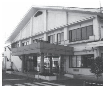
《泉寿園》☎27-3818 今泉町 1-2-7