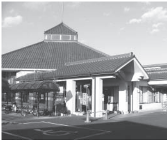
《福寿園》☎31-3666 千塚町 210