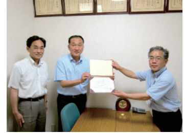
大木生コン株式会社