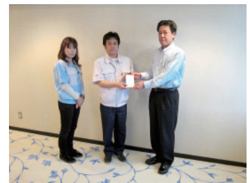
セイコーインスツルメンツ労働組合

※上記の他にも社会福祉協議会窓口の収集箱に、使用済切手・使用済テレホンカードを多数ご寄付いただきました。ありがとうございました。