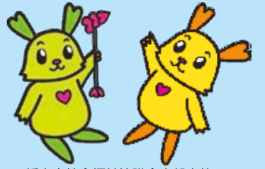
栃木市社会福祉協議会広報大使 ふつくん・ぴーちゃん

編集・発行 社会福祉法人 栃木市社会福祉協議会 ホームページ http://www.tochigishi-shakyo.or.jp/ メールアドレス: somu-tochigi@tochigishi-shakyo.or.jp 〒328-0027 栃木市今泉町2-1-40(栃木保健福祉センター内) ☎0282-22-4457 FAX 0282-22-4467