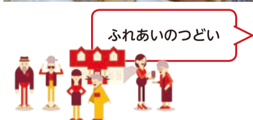
ふれあいのつどい