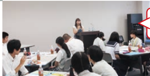
蔵の街 高校生ボランティア