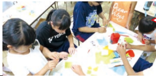
サマーボランティア — 学童保育体験 —