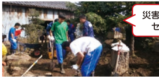
災害ボランティアセンター運営