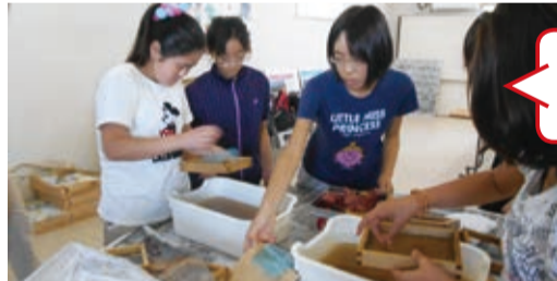
サマーボランティア — 紙すき体験 —