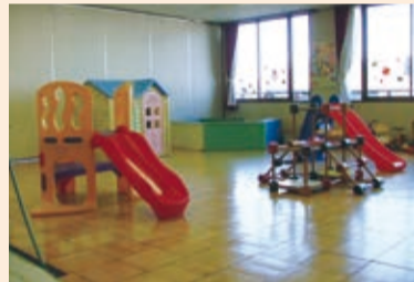
いまいずみ児童館