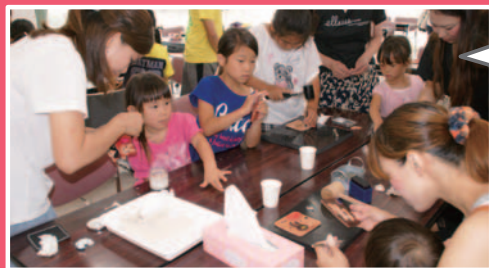
親子を対象とする ふれあい教室