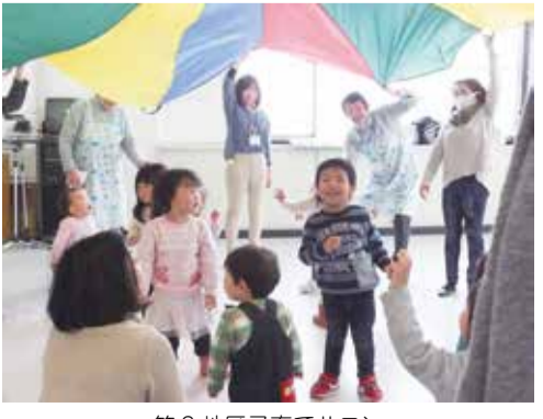
蔵の街高校生ボランティアスクール