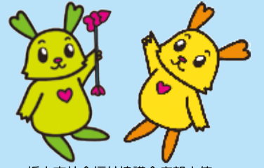
栃木市社会福祉協議会広報大使 ふつくん・びーちゃん