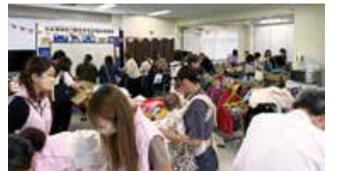
TOCHICO リサイクルの様子