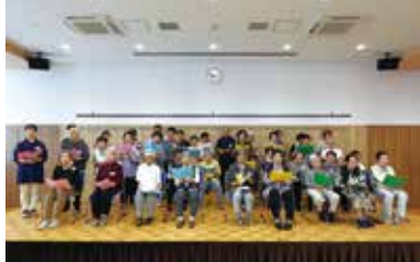
コーラス練習の様子