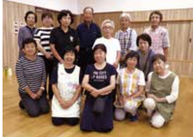
ボランティアの皆さん

サロンは「友達に会える場所」であり、参加者の笑顔を増やし、生きがいを生み出しています。この日の活動は、イベントでの発表に向けたコーラス練習です。「参加者もボランティアもみんなで一緒にステージに立つ」という大きな目標を掲げています。歌声を合わせてひとつになれるのは、このサロンが歩んできた歴史と、ボランティアと参加者で築き上げてきた一体感の証です。これからもこのサロンが、ボランティアの活躍により、末永く地域に愛され、全員が笑顔であり続けられることを心から願っています。