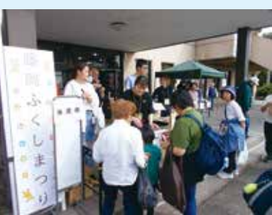
抽選会当たるかな？