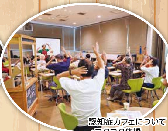
認知症カフェについて ・コタコタ体操